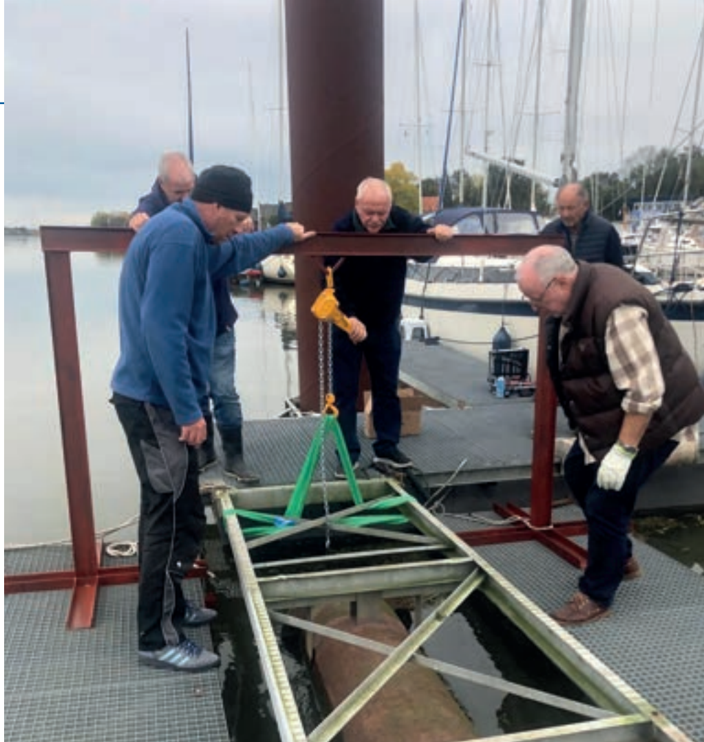
Met een speciaal hiervoor ontwikkelde Catamaran-kraan verwijderen Ascloa-vrijwilligers de eerste lekkende drijver

Onze kraan is zoals elk jaar gecertificeerd en zal nogmaals onderzocht worden op zwakke plekken in het metaal en in de ophangingen. Een onafhankelijk ingenieursbureau heeft een lastenberekening gemaakt. Daaruit blijkt dat de kraan boten met een gewicht tot 2 ton mag tillen.