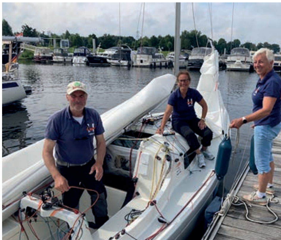
Team Peulen bij de start van de Euregio Regatta 2024 in Ophoven

Auch die jungen Segler sind hiermit herzlich eingeladen!