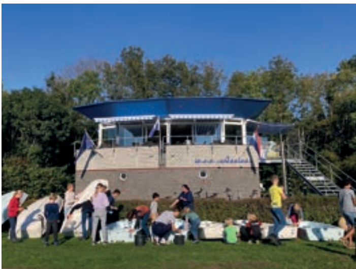
De jeugdopleiding van Ascloa geniet een grote faam. Elk jaar worden meer dan 20 cursisten met succes opgeleid. De opleiding wordt afgesloten met de uitreiking van een diploma en een feestje, waarvan ook trotse ouders genieten.