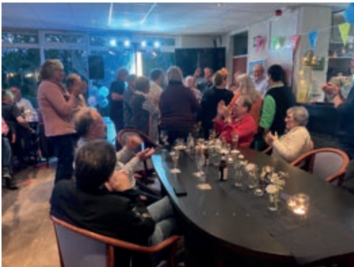
De leden van Ascloa genieten op het water van hun sport, maar ontmoeten elkaar ook regelmatig bij een barbecue of op een feestje in het clubhuis. Dergelijke 'ontmoetingen' zijn niet alleen gezellig, maar versterken ook het clubgevoel en de onderlinge band.