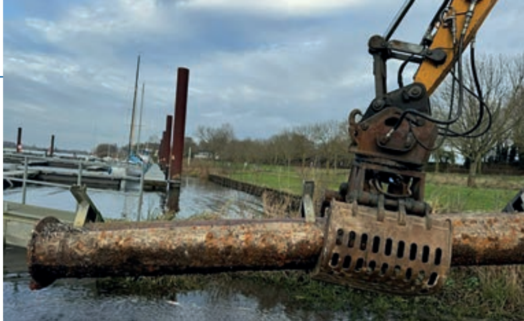
Das Entfernen des leckenden Schwimmers aus Stahl. Danach wird geprüft, was die beste Lösung ist: Kunststoff oder Stahl

Zum Tagesgeschäft von Ascloa gehören auch Investitionen in die Infrastruktur, wie die Steganlage und das Clubhaus. Dank der positiven Ergebnisse, die wir in den letzten 15 Jahren erzielt haben, haben wir reichlich Rücklagen gebildet. Ein Drittel des Geldes wollen wir für die Erneuerung von undichten Schwimmern unter den Stegen verwenden. Dieter und Theo testen zwei Methoden, mit denen die Schwimmer vor Ort durch Kunststoffschwimmer oder durch Stahlrohre ersetzt werden können, so wie es bei den jetzigen Schwimmern auch der Fall ist. Wir gehen davon aus, dass alle Schwimmer der Fingerstege innerhalb der nächsten 10 Jahre ersetzt werden müssen, sobald sie undicht werden. Im Clubhaus müssen die Sanitäranlagen erneuert werden und durch ein neues Kalt-/Warmwasserleitungssystem ersetzt werden, um die Bildung von Legionellen zu verhindern. Das Problem ist, dass die Sanitäranlagen nicht ausreichend genutzt werden, so dass sich sogar in den Kaltwasserleitungen Legionellen bilden.